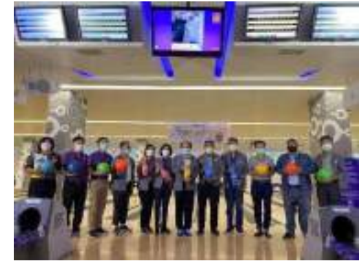
14. สำนักงานทรัพยากรธรรมชาติและสิ่งแวดล้อมจังหวัดสระบุรี ขอเชิญร่วมการแข่งขันโบว์ลิ่ง นบส.2 รุ่นที่ 14 ได้จัดการแข่งขัน "โบว์ลิ่ง นบส.2 รุ่นที่ 14" เพื่อรายได้สนับสนุนการทำกิจกรรมสาธารณประโยชน์และสนับสนุนการดำเนินกิจกรรมต่างๆ ของผู้เข้ารับการอบรมโครงการพัฒนานักบริหารระดับสูง สนับสนุนงบประมาณ จำนวน 10,000 บาท