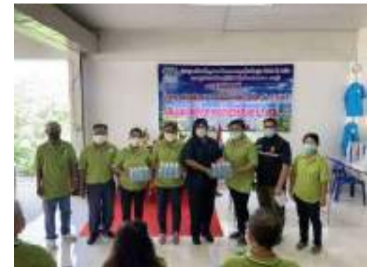
16. ชมรมผู้สูงอายุบ้านชัยบอน หมู่ 5 ต.ทับทิม ขอนุเคราะห์น้ำดื่ม จัดกิจกรรมประชุมประจำเดือนของชมรมผู้สูงอายุบ้านชัยบอน เพื่อชี้แจงกิจกรรมต่างๆ และดูแลสุขภาพเบื้องต้นให้แก่ผู้สูงอายุบ้านชัยบอน สนับสนุนน้ำดื่มตราทิฟไอ ขนาด 350 ml. จำนวน 10 โหล