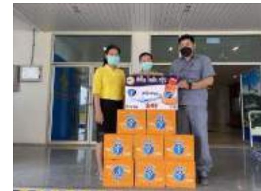
12. สำนักงานส่งเสริมการปกครองท้องถิ่นจังหวัดสระบุรี ขอรับการสนับสนุนน้ำดื่ม จัดทำโครงการประชุมการขับเคลื่อนนโยบายรัฐบาลและการดำเนินงานในบทบาทขององค์กร เป็นประจำเดือน สนับสนุนเครื่องดื่ม Pro vita จำนวน 8 ลิ้ง