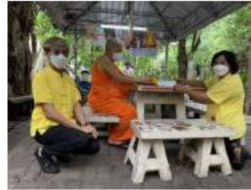
13. แผนกประชาสัมพันธ์ บริษัท ทีพีโอ โพลีน จำกัด (มหาชน) ขอสนับสนุนงบประมาณกิจกรรมประเพณีตักบาตรดอกเข้าพรรษา ประจำปี 2565 เป็นประเพณีที่สำคัญของจังหวัดสระบุรี และมีแห่งเดียวในโลกสนับสนุนงบประมาณ จำนวน 10,000 บาท