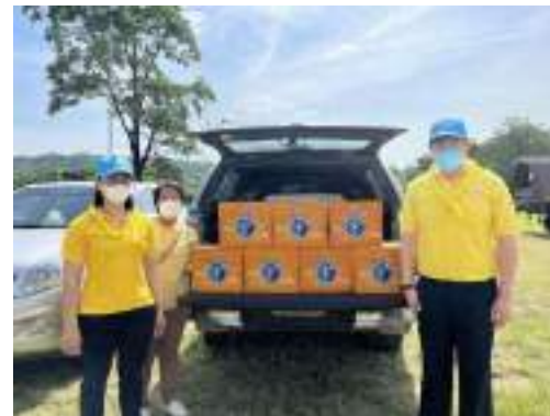
15. องค์การบริหารส่วนตำบลมิตรภาพขอความอนุเคราะห์น้ำดื่ม ได้ร่วมกันจัดทำโครงการจิตอาสา"เราทำความดีด้วยหัวใจ" เพื่อทำความสะอาดรอบๆบริเวณโรงเรียนมวกเหล็กวิทยา เนื่องในโอกาส ทูลกระหม่อมหญิงอุบลรัตนราชกัญญา สิริวัฒนาพรรณวดี จะเสด็จเยี่ยมสมาชิกและติดตามผลการดำเนินงานโครงการ TO BE NUMBER ONE จังหวัดสระบุรี สนับสนุนเครื่องดื่ม Pro vita จำนวน 10 ลัง