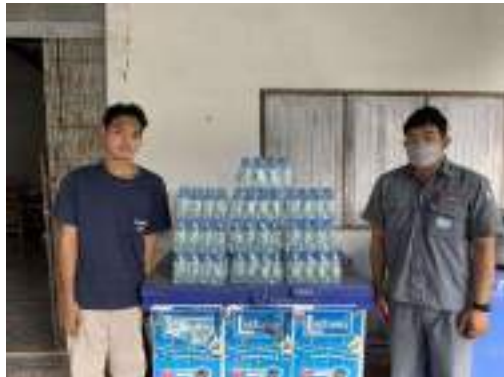
7. วัดบำเพ็ญบุญ (บ้านไทย) หมู่ 3 ต.ทับทวน ขอนุนเคราะห์น้ำดื่ม งานฌาปนกิจศพนายใจ ขำคำ ชาวบ้านตำบลทับทวน สนับสนุนน้ำดื่มตราทิฟไอ ขนาด 350 ml. จำนวน 10 โหล