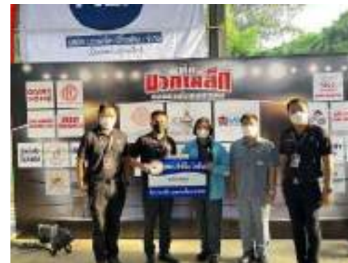
11. คณะกรรมการจัดการแข่งขันศึกมวกเหล็ก ยอดมวยโลก มหาฤศล ต.มวกเหล็ก ขอรับการสนับสนุนงบประมาณ โครงการจัดการแข่งขันชกมวย "ศึกมวกเหล็ก ยอดมวยโลกมหาฤศล" เพื่อส่งเสริมการท่องเที่ยวของอำเภอมวกเหล็ก และหารายได้มอบให้เป็นสาธารณกุศลแก่ศาลเจ้าพ่อมวกเหล็กต่อไป สนับสนุนงบประมาณ 15,000 บาท