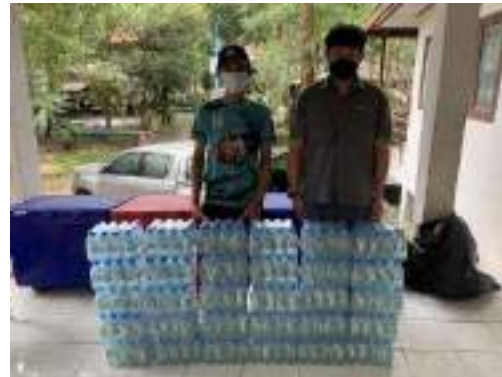
8. วัดธนพัฒนามาราม(ถ้ำสะพานหิน) หมู่ 6 ต.มิตรภาพ ขอนุนเคราะห์น้ำดื่ม งานฌาปนกิจศพนางนารี มีบุปผามารดา อดีตรองนายกองค์การบริหารส่วนตำบลมิตรภาพ สนับสนุนน้ำดื่มตราทิฟไอ ขนาด 350 ml. จำนวน 30 โหล